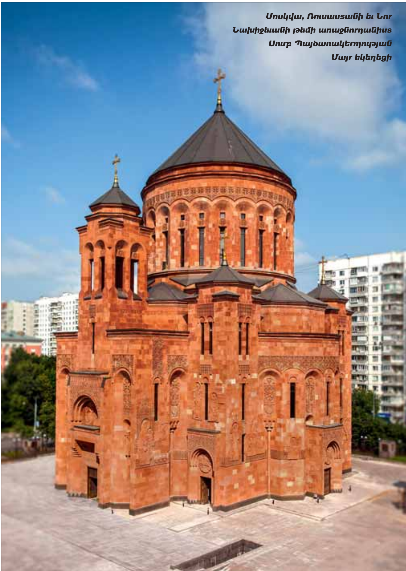
Մոսկվա, Ռուսաստանի եւ Լոր Նախիջեանի թեմի առաջնորդանիս Սուրբ Պայծառակերտության Սայր եկեղեցի